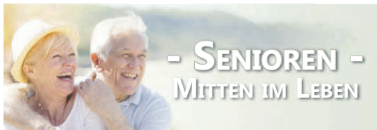
* KW29: Pattonville, Oeffingen