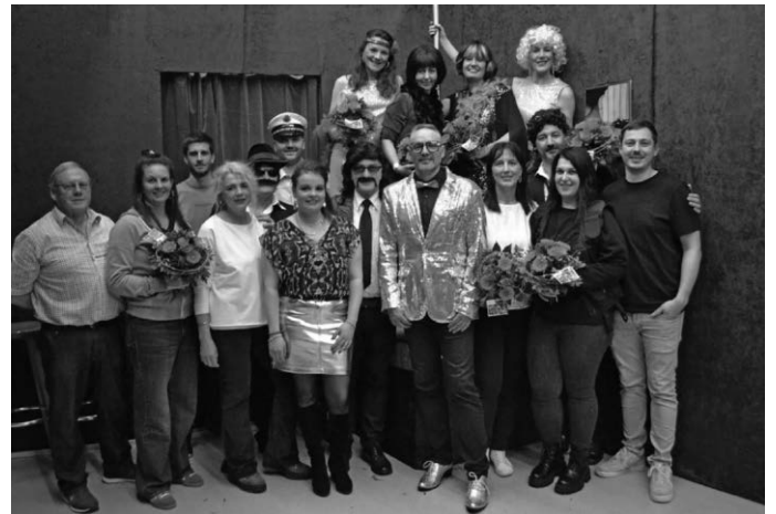
Die Gutenzeller Theatergruppe

Gutenzell bedankt sich herzlich bei allen Akteuren auf und hinter der Bühne, die den zahlreichen Theaterbesuchern unter der Regie von Jürgen Lendler ein großartiges Schauspiel geboten haben. Ein herzliches Dankeschön gilt auch den vielen fleißigen Helferinnen und Helfern, die mit ihren Arbeitseinsätzen zum Gelingen des diesjährigen Theaters beigetragen haben! Ebenfalls bedanken wir uns herzlich bei allen Theaterbesuchern und hoffen, sie auch in der kommenden Theatersaison wieder begrüßen zu dürfen.