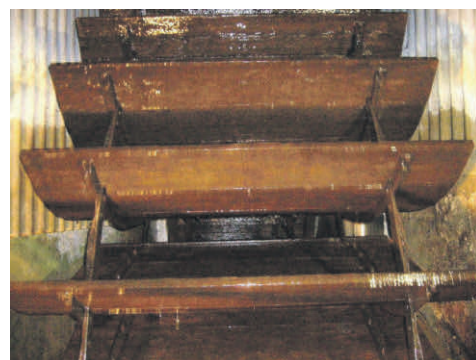
Blick ins Wasserrad

-> Bei der Sägmühle 1, 88484 Gutenzell-Hürbel