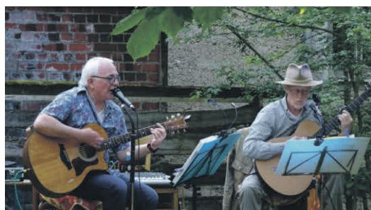
Konzert mit After Midnight 2023

Bei schönem Wetter hinter der Sägmühle im Freien, ansonsten in der Sägmühle